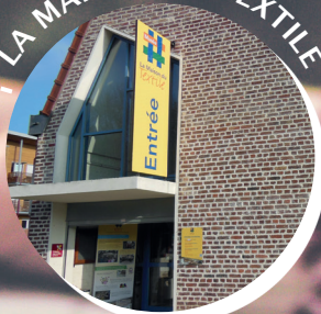
LA MAISON DU TEXTILE