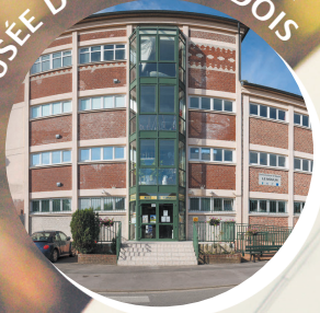
LE MUSÉE DU VERMANDOIS